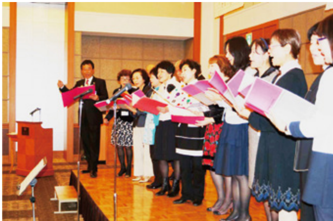
▲ 第二部の懇親会ではアトラクションとして豊橋西LCコーラス部員が会場を盛り上げた。