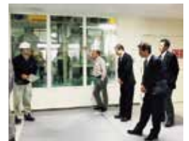
再生エネルギーなどについて勉強をしてきました。